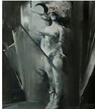
Amygdala, 40x35 cm, olej na plátně, 2012