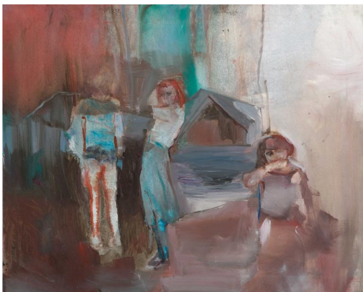
J. Vojnárová: Dvě dívky a ztracený kluk, 60x75cm, olej na plátně

Určitým impulsem mi byla už práce na obrazech z předešlého roku, kdy jsem zachycovala převážně skupiny děti při židovských svátcích, rituálech a podobně. Pro rodinný příběh jsem se rozhodla s návazností právě na toto. Jde o příběh z 2. světové války, kdy můj děda zemřel a babička se pak s mým tátou ukrývala a snažila přežít.